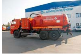
АКН-10Т-ОД PNR УСТ5453 Камаз 43118-3078-RF, Автоцистерна вакуумная с открывающимся днищем, 10 куб.м., термоизоляция