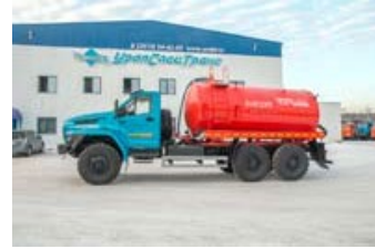
МВ-10Т КО УСТ 5453 Урал 4320-72 NEXT, Автоцистерна вакуумная "термос", насос КО-505, Урал 4320-72NEXT, термоизоляция