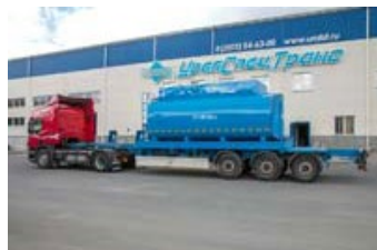
КЦ-20 УСТ-94653, Контейнер-цистерна, 20 куб.м, термоизоляция