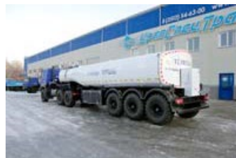
ППЦТВ 26Т-31 УСТ-94651 рамная, Полуприцеп-цистерна для техводы, 26 куб.м, термоизоляция