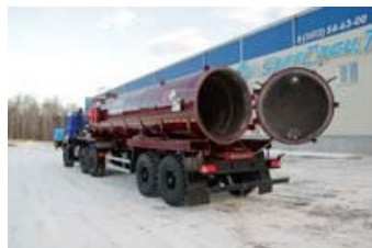
ППЦВ 20Т-21-ОД УСТ-94651 рамная, Полуприцеп- цистерна вакуумная, 20 куб.м, термоизоляция