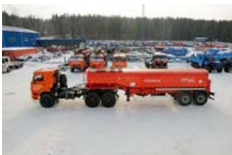
ППЦН 26Т-21 УСТ-94651 рамная, Полуприцеп-цистерна для нефти (нефтевоз), 26 куб.м, термоизоляция