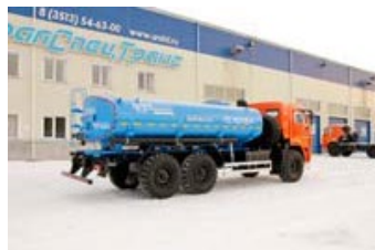
АЦВТ-11 УСТ-5453 Камаз 43118-46, Автоцистерна для технической воды, 11 куб.м, термоизоляция