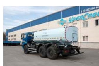
АЦПТ-10 УСТ-5453 Камаз 43118-46, Автоцистерна для питьевой воды, 10 куб.м., насос, термоизоляция