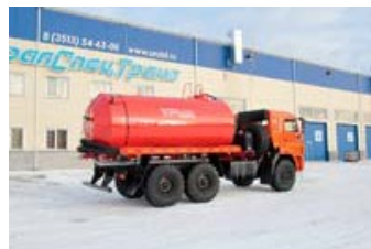
МВ-10Т КО УСТ-5453 Камаз 43118-46, Автоцистерна вакуумная, 10 куб.м, насос КО-505, термоизоляция