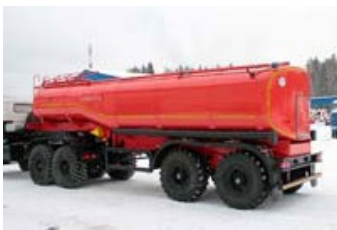
ППЦТВ-20Т-21Н УСТ-94651 рамная, Полуприцеп-цистерна для технической воды, 20 куб.м, насос, термоизоляция