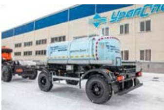
ПЦПТ 6-21 УСТ 94651 рамная, Прицеп-цистерна для пищевых жидкостей, 6 куб.м, термоизоляция