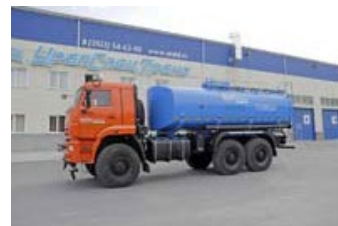
АЦВТ-15 УСТ-5453 Камаз 65224-43, Автоцистерна для технической воды, 15 куб.м, насос, термоизоляция